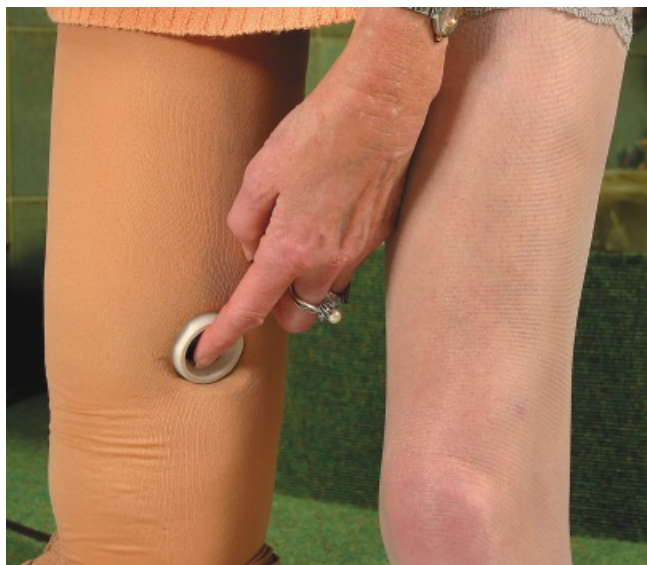
Der Stumpf hat einen festen und sicheren Sitz.